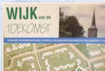
Wijk van de Toekomst, gesprekken met alle bewoners