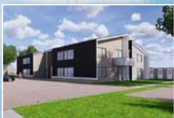
Project Zuid-Es te Rolde