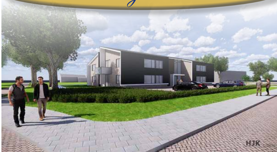
Illustraties: Zuid-Es te Rolde