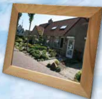
Gezamenlijk woonruimte verdeelsysteem voor heel Drenthe