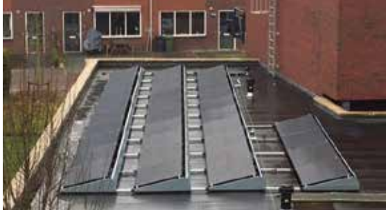
De Hoefslag te Gasselte

Zoals u in het Bewonersblad heeft kunnen lezen, wil Woningstichting De Volmacht zich de komende jaren o.a. inzetten op het