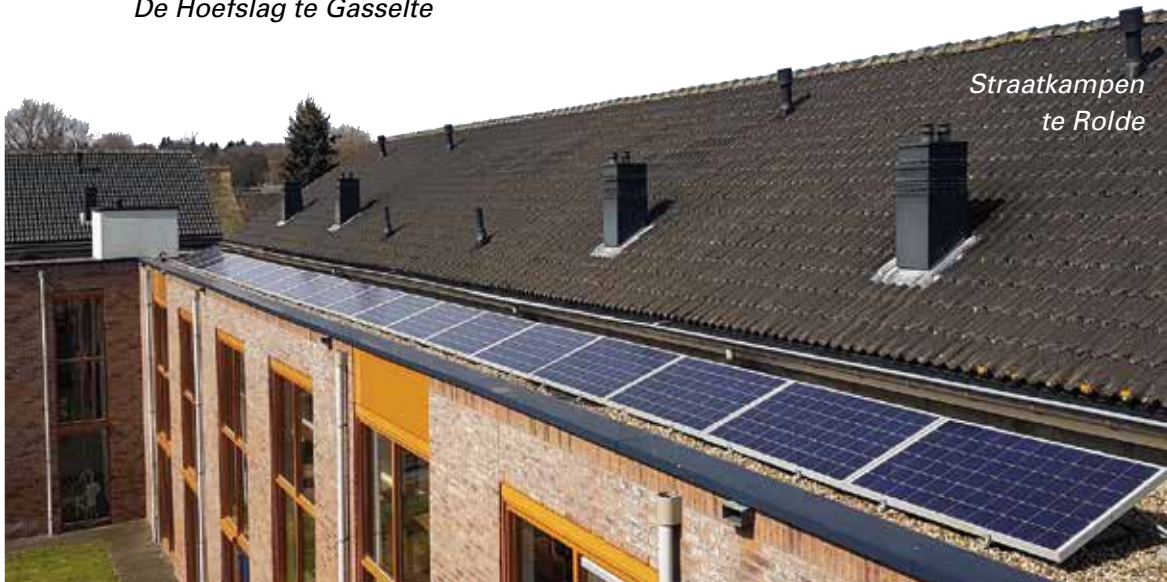
Straatkampen te Rolde

Deze investering zal zich na een aantal jaren gaan terugverdienen ten gunste van de energiekosten voor het algemeen gebruik, denk hierbij een elektrakosten van de lift, buitenverlichting, etc.