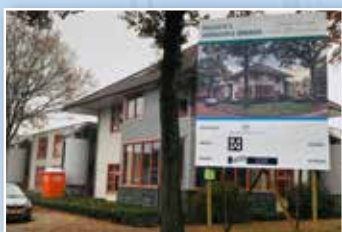
Transformatie kinderdagopvang naar 3 woonappartementen