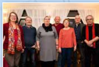
Huurdersvereniging De Deelmacht