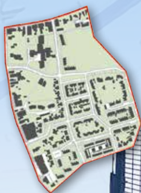
Proeftuin Drenthe woont circulair