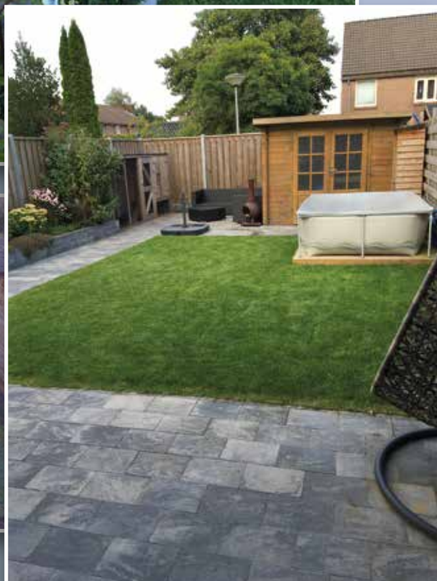
Links de oude situatie. Rechts de gerenoveerde tuin.